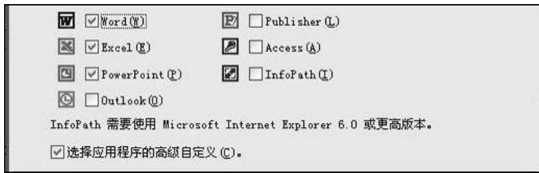
图 1-1 选择三个组件和选择“选择应用程序的高级自定义”选项

(3) 在“高级自定义”画面中，在“Word”、“Excel”、“PowerPoint”、“Office 共享功能”和“Office 工具”的下拉菜单中选择“在本机运行全部程序”，对于其他组件都选择“不安装”，如图 1-2 所示。