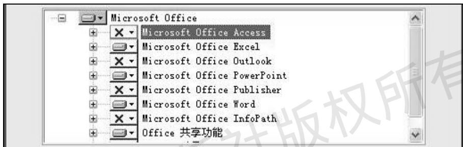
图 1-2 选择组件的安装内容

(3) 在“高级自定义”画面中，在“Word”、“Excel”、“PowerPoint”、“Office 共享功能”和“Office 工具”的下拉菜单中选择“在本机运行全部程序”，对于其他组件都选择“不安装”，如图 1-2 所示。